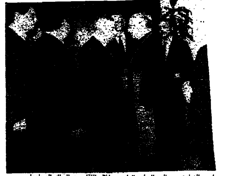
رئيس الهرراوي يصافح السفير الياباني خلال اللقاء مع السلك الدبلوماسي